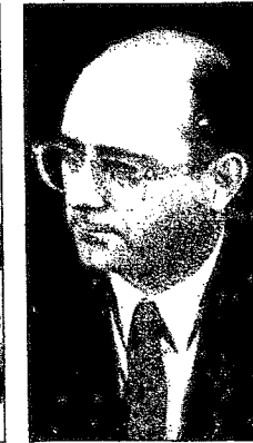
■ ROMAN ZULAIKA

El nacionalista Martín Elizasu, especializado en asuntos urbanísticos, se hará cargo de la dirección de Infraestructuras y Grandes Obras, así como de la dirección de Proyectos y Obras. Elizasu será el cuarto teniente de alcalde de Donostia y bajo su responsabilidad se encontrarán sociedades como Aneota Kiroldegia, la comisión de seguimiento del Plan General y otras entidades que tengan como finalidad el desarrollo de las infraestructuras de la ciudad.