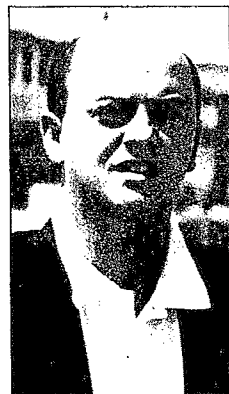
■ GREGORIO ORDÓÑEZ

La futura comisión de gobierno donostiarra se reunirá por primera vez el próximo viernes para quedar constituida. Posteriormente, esta reunión semanal se celebrará los martes, como ha venido siendo habitual. En la actualidad, los responsables del equipo de gobierno tripartito de Donostia están redactando el nuevo reglamento orgánico, que deberá ser aprobado en la próxima sesión plenaria que, según Elorza, tendrá lugar en breve.