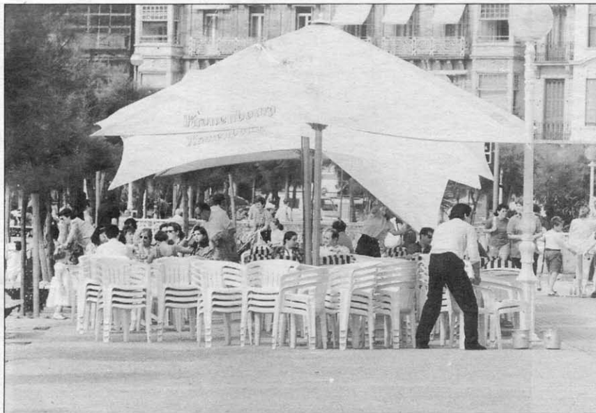
El verano y el mayor trasiego de gente anima a que aparezcan más terrazas en la ciudad.

El Ayuntamiento pone una serie de condiciones generales a todos los establecimientos con autorización para ocupar la vía pública. La colocación de las mesas