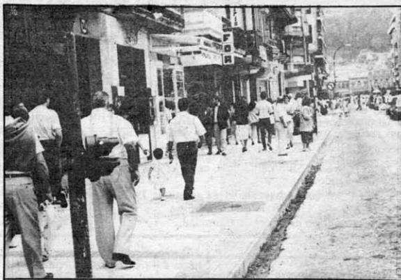
La calle Urbieta está recuperando la normalidad.

Ordóñez manifestó ser consciente de los problemas que pueden enturbiar su gestión. «De nada pueden servir los acontecimientos de primera magnitud si un grupo de anti donostiarros queman coches extranjeros o se dedican a llevar a traste todas las iniciativas que se adopten. Sin embargo, quiero decir que asumo la delegación con la idea de que, entre todos, vamos a tirar hacia arriba con más fuerza que la de aquellos que quieren hundir San Sebastián».